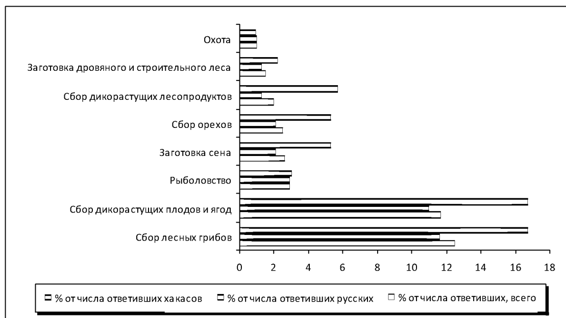
Рисунок 2. Традиционное природопользование в Республике Хакасия с целью отчуждения

окружающей среды Республики Хакасия, здесь более 9 тыс. охотников и 22 охотпользователя (юридическое лицо или индивидуальный предприниматель, осуществляющий охотохозяйственную деятельность).