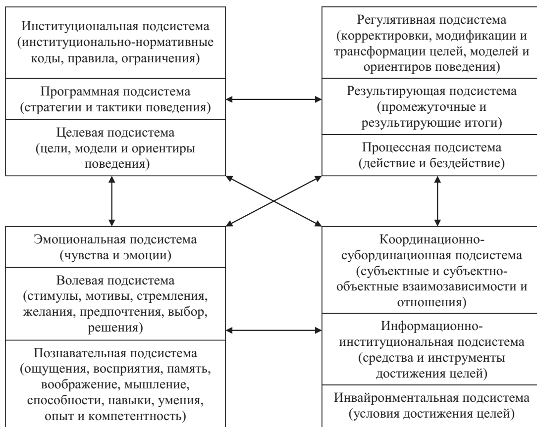
Рисунок 2. Структура экономического поведения*

тивную природу и представляет собой совокупность 12 взаимосвязанных подсистем – познавательной, волевой, эмоциональной, целевой, программной, институциональной, инвайронментальной, информационно-инструментальной, координационно-субординационной, процессной, результирующей и регулятивной (рис. 2).